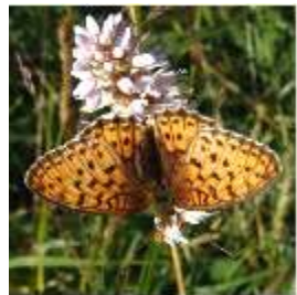
Kaisermantel auf Knöterich