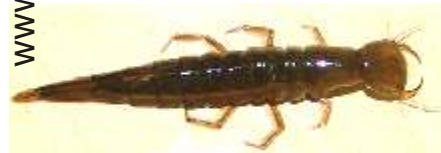
Larve des Gelbrandkäfers