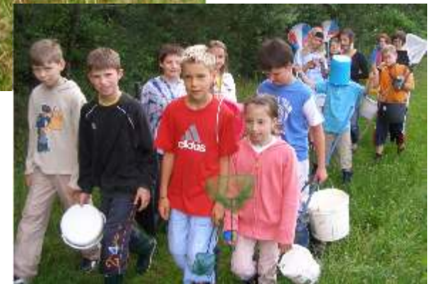
Ausrüstung (Weiher) Eimer, Kescher, Lupe