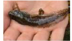
Kaulquappe (später: Frosch)