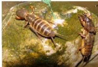
Larve der Mosaikjungfer