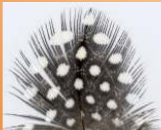
Wer hat das Muster in die Feder gemacht?